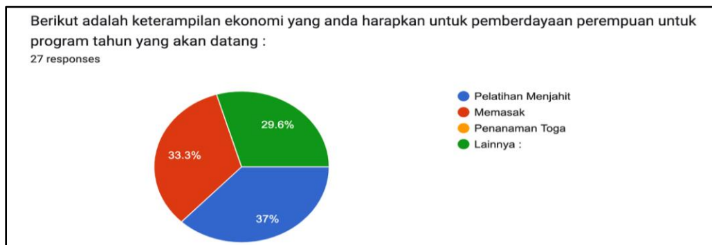
Gambar 3. Jenis-jenis Keterampilan yang diminati untuk Program Pemberdayaan, Desa Tejoasri Tahun 2024.