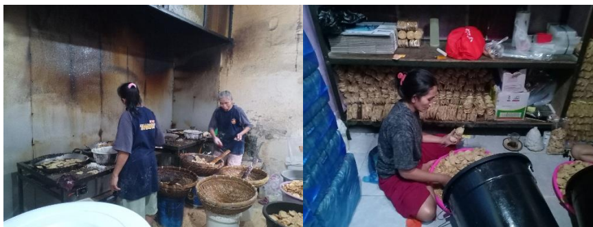
Gambar 1: Wanita dan Aktifitas Pekerjaannya

Fenomena yang menggambarkan wanita merasa dirinya mandiri apabila memiliki kemampuan dan terlibat dalam mencari nafkah ataupun menghasilkan produk dalam industri rumah tangga, sehingga mereka mendapat manfaat positif bukan hanya dari penghasilan saja namun mereka merasakan ada proses pembelajaran ekonomi bagi dirinya dan keluarga. Studi pada (Tolibovna, 2023) dalam konteks kewirausahaan yang dilakukan oleh perempuan memiliki dampak signifikan dan positif terhadap pertumbuhan ekonomi. Berdasarkan berbagai penelitian, peran pengusaha perempuan sangat krusial bagi pembangunan ekonomi. Hal ini diperkuat oleh studi-studi yang menunjukkan bahwa pengusaha perempuan tidak hanya berkontribusi pada penciptaan lapangan kerja, tetapi juga bertindak sebagai kekuatan pendorong utama dalam memajukan perekonomian. Makna dalam temuan ini sinergi dengan kemampuan wanita saat memiliki keterlibatan mencari nafkah bahkan ada manfaat lain yakni kontribusi dalam terciptanya lapangan kerja. Gambar 1 berikut menunjukkan kondisi wanita dan pekerjaannya di obyek penelitian: