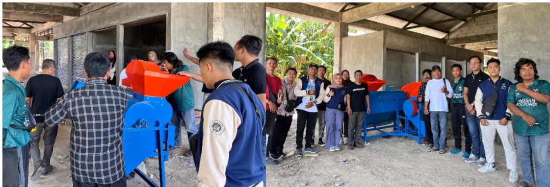
Gambar 3: Pelatihan pengoperasian mesin pengolah sampah

anorganik. Kehadiran mesin pemilah sampah membantu petugas sampah Desa Sidowungu memisahkan sampah organik dan anorganik (terutama sampah plastik), sehingga penanganan dan pengolahan selanjutnya semakin mempermudah. Disadari bahwa keberadaan mesin pengolah sampah tidak dapat menyelesaikan seluruh masalah sampah secara tuntas. Namun, setidaknya ini sangat membantu mengurangi volume sampah dan, secara bertahap, nantinya akan mencapai volume yang minimal.