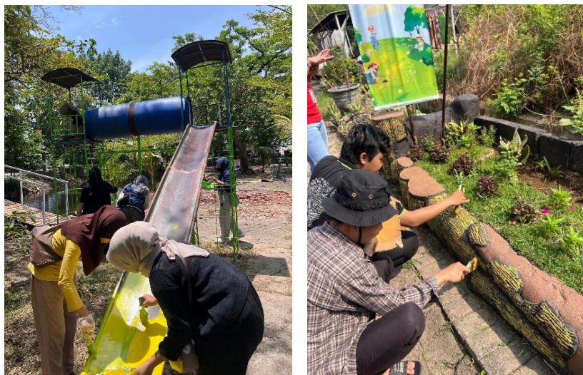
Gambar 2: Perbaikan wahana wisata dan taman

Terhentikannya aktivitas ekowisata Telaga Boro akibat pandemi Covid-19 membuat lokasi wisata terbengkalai dan kondisinya memprihatinkan. Banyak fasilitas dan wahana wisata yang rusak karena tidak terawat. Lebih parahnya, banyak sampah rumah tangga yang dibuang warga sekitar menumpuk di kawasan Telaga Boro. Tim Pelaksana melakukan pendampingan bersama pengurus BUMDes serta Relawan Pelestari Telaga Boro dalam revitalisasi ekowisata dan pemeliharaan lingkungan. Revitalisasi ekowisata Telaga Boro diawali dengan penataan kawasan Telaga Boro (tata letak taman dan wahana wisata) serta perbaikan fasilitas wahana wisata yang rusak. Gambar 2 mengilustrasikan kegiatan perbaikan fasilitas wahana wisata Telaga Boro.