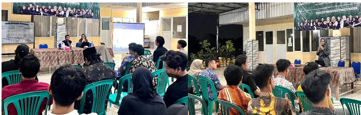
Gambar 2: Pelatihan motivasi kewirausahaan dan manajemen bisnis

Intervensi pembinaan pada program ini pada prinsipnya bertujuan untuk mengembangkan kapabilitas manajerial para pengurus BUMDes Bangun Bersama dan pokdarwis Desa Sidowungu, agar memiliki keberdayaan untuk mampu mengreasikan ide guna meningkatkan produktivitas serta secara efektif dan efisien memobilisasi diri tanpa tekanan dari luar (Jun jo & Park, 2016). Berpijak pada latar belakang pengurus BUMDes Bangun Bersama dan anggota pokdarwis Desa Sidowungu yang tidak memiliki kapabilitas dan pengalaman di bidang bisnis, pelatihan yang diberikan diarahkan secara khusus untuk menumbuhkembangkan kapabilitas manajerial dan bisnis mereka. Pelatihan yang diberikan meliputi: (1) motivasi kewirausahaan, mencakup peran dan tugas BUMDes dalam perekonomian dan kesejahteraan desa; (2) manajemen bisnis, mencakup manajemen operasi,