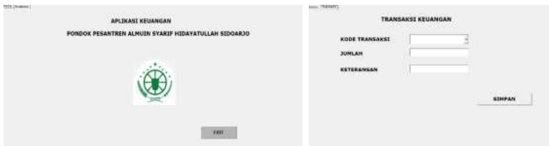
Gambar 3 Tampilan Aplikasi (a) Home (b)Transaksi

Menu transaksi terbagi menjadi 2 yaitu pemasukkan dari para donatur dan pengeluaran yang dilakukan oleh Pondok pesantren Almuin untuk kegiatan sehari-hari ponpes.