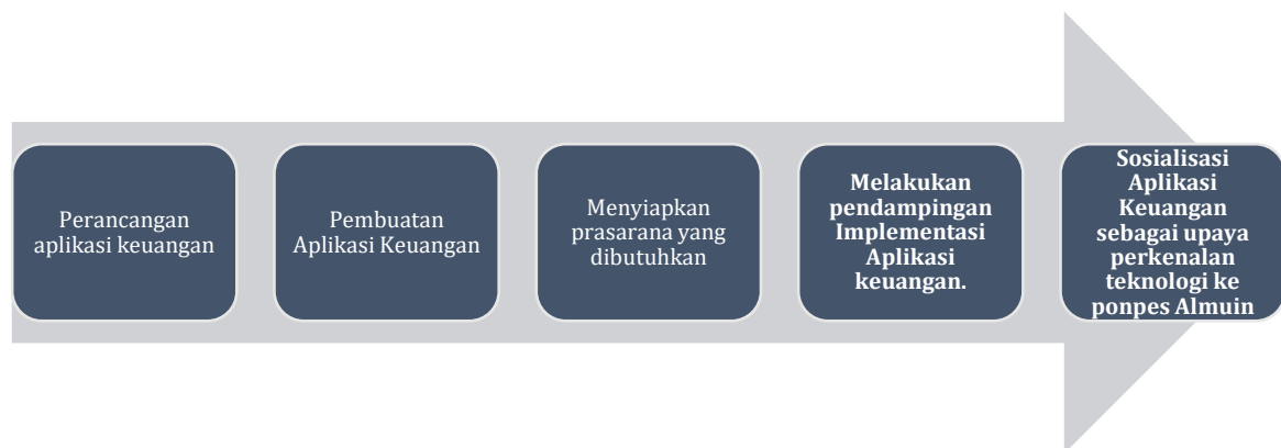
Gambar 1 Metode Pelaksanaan

Metode pelaksanaan kegiatan pengabdian kepada masyarakat yang ditunjukkan pada gambar 1, dapat dijelaskan sebagai berikut :