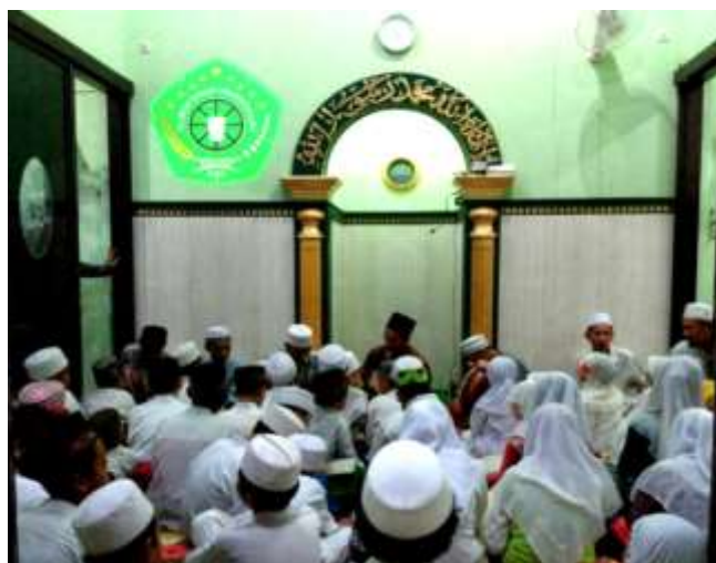
Gambar 2 Kondisi Pondok Pesantren Almuin

Kegiatan pengabdian masyarakat diawali dengan Analisa kondisi mitra dengan observasi lapangan dan wawancara dengan pengelola pondok pesantren Almuin. Berdasarkan hasil wawancara dengan pengelola pondok terdapat permasalahan terkait jumlah sumber daya pengelola Pondok Pesantren Almuin yang sedikit, sehingga mengakibatkan proses administrasi khususnya pengelolaan keuangan dari para donator tidak tercatat dengan baik. Hal ini menimbulkan sering terjadi kesalahan jumlah laporan keuangan. Selain itu, sebagian besar sumber daya pengelola yang belum memahami cara penyusunan laporan keuangan dengan benar.